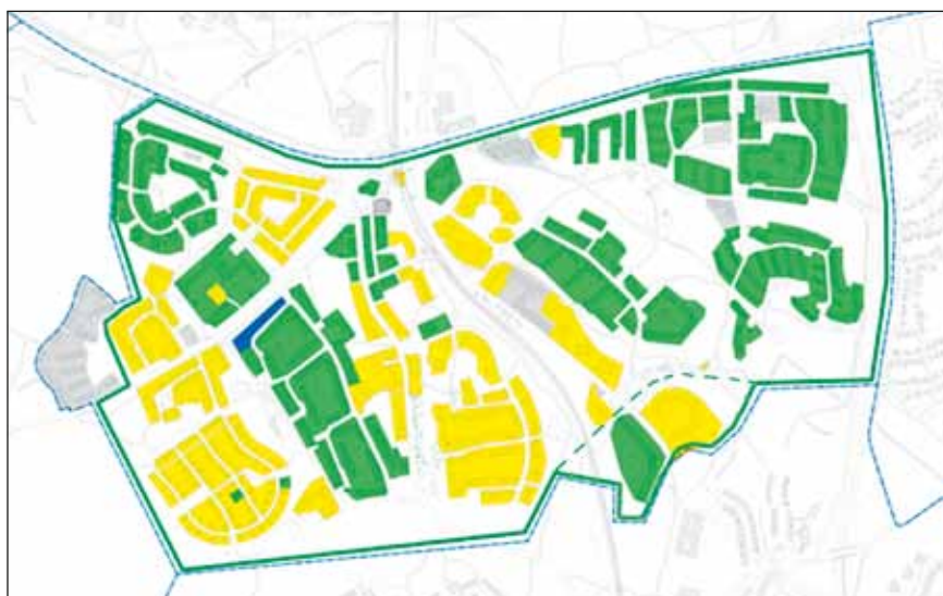
Karta över Hökarängen ur Stadsmuseets faktablad.

De kulturhistoriska klassificeringarna kan inte överklagas, men naturligtvis ändras om något i beskrivningen av byggnaden skulle blivit fel. Och dessutom kan ju bygglov eller nya detaljplaner överklagas, exempelvis med hänvisning till kulturhistoriska värden. Klassificeringarna betyder inte automatiskt att all förändring i en byggnad eller ett område är förbjuden, utan att det ska bedömas i bygglovs- eller planlovsprocessen. Hänsynsfulla större förändringar kan ges bygglov, liksom att små förändringar kan bedömas som kraftigt förvanskande. I detaljplaner markeras kulturhistoriska