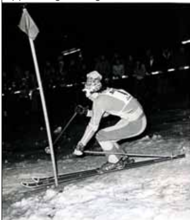
och den 3 januari 1975 var det rekordfart i backen när Ingemar Stenmark (bilden) tävlade utför mot Jean-Claude Killy. Redan 1994 stängdes skidbanläggningen på Högdalstoppen. Samtida bilder från Högdalstoppen kommer från Stockholmskällan.

Lite kul minnen från den tid då vi hade en skidlift på Högdalstoppen och Högdalens Slalomklubb. På 70-talet åkte bland annat Ingemar Stenmark och Jean Claude Killy en uppvisningstävling i backen.